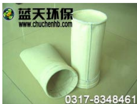
• PPS 滤