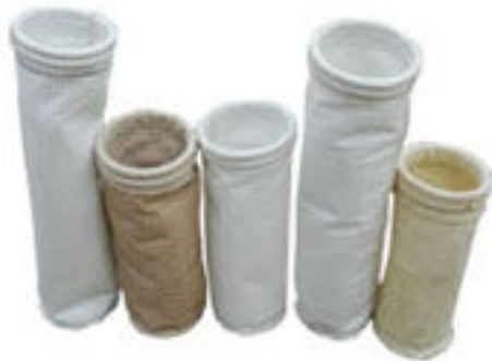
涤纶 729、208 除